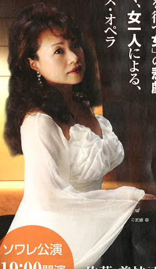
佐藤 美枝子 (ソプラノ)